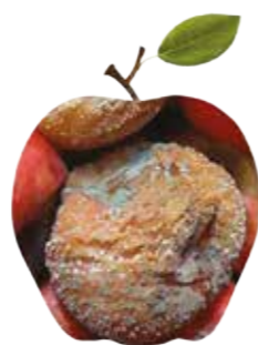
Penicillium expansum Putregaiul albastru