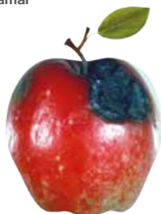
Alternaria mali Putrezirea amară