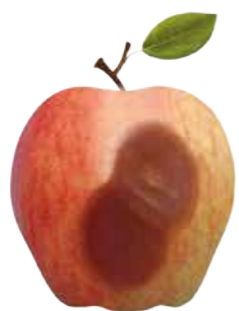
Gloeosporium spp. Putregaiul amar

Aplicat înainte de recoltare, Bellis® reduce semnificativ pierderile cauzate de bolile de depozitare.