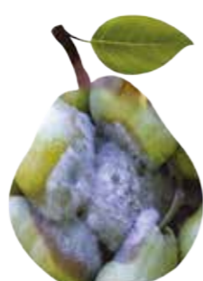
Botrytis cinerea Putregaiul cenușiu