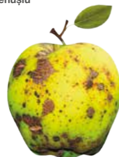
Venturia inaequalis Rapănul la măr