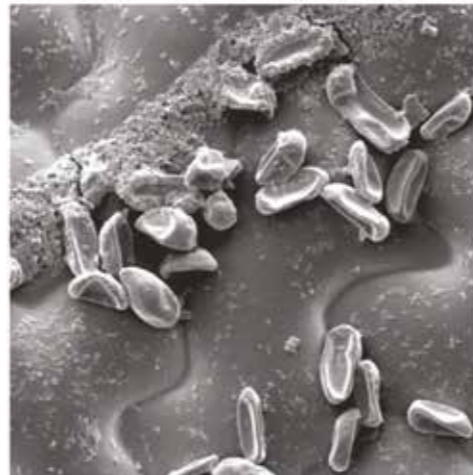
Conidii după tratamentul cu Cantus®